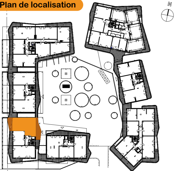
Plan de localisation