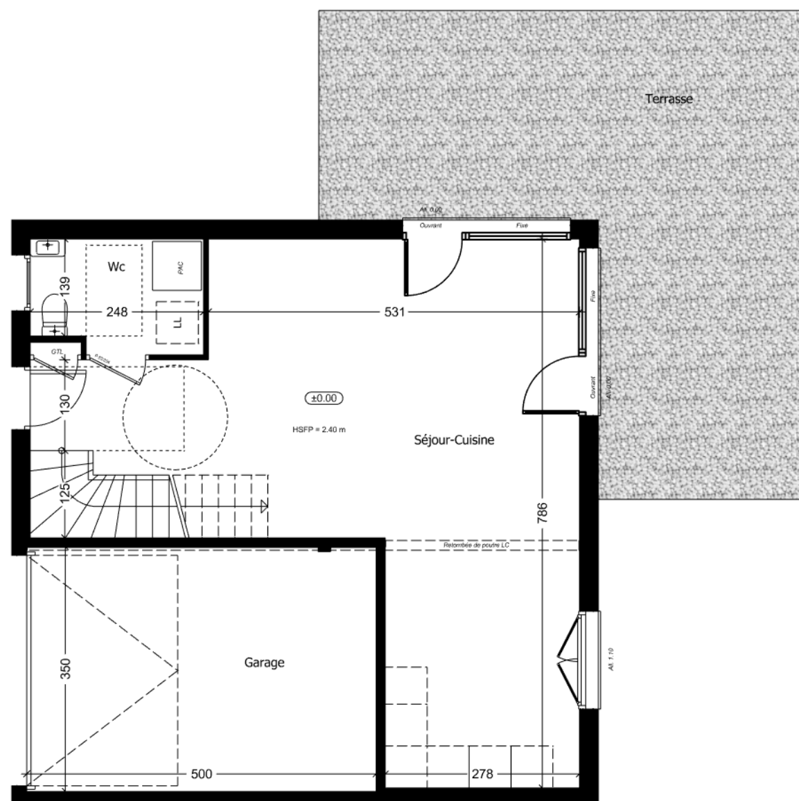
Rez de jardin